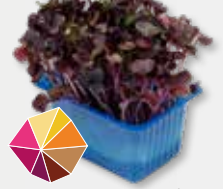
Sakura Cress® Radijs, rammenas