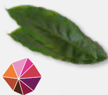
Cardamom Leaves Kaneel, houtachtig, licht zoet