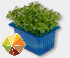
RucolaCress® Noten 1)