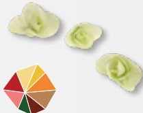
Floremano® Oregano, zomers