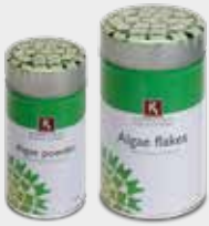
Algae powder Algae flakes Umami