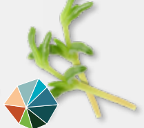
Salty Fingers® Ziltig, knapperig, licht bitter