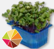
Chilli Cress Scherpe mosterd