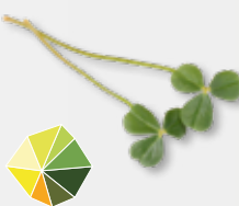
Citra Leaves® Friszure citrus tonen