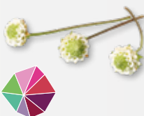
Dushi® Buttons Zoet, munt, tijm, zoeter dan suiker