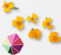
Anise Blossom Anijs, dragon