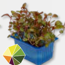
Adji Cress Zwarte peper