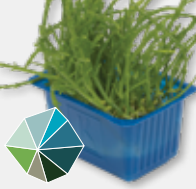
Salicornia Cress Zoutachtig, knapperig