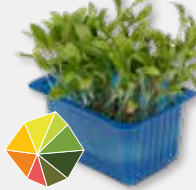
Ghoa Cress® Citrus, milde koriander