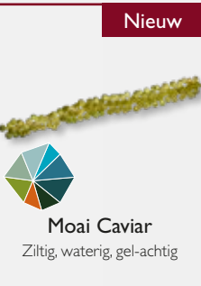
Moai Caviar Ziltig, waterig, gel-achtig