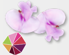
Bean Blossom Frisse bonen