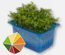
Garden Cress 2) Mosterd, pittig, radijs