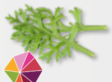
Kikuna® Leaves Wortel, selderij