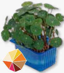
Zorri Cress Pittig, mierikswortel