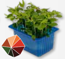
Tahoon® Cress Beukenootjes, paddenstoel, truffel