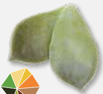
Majji® Leaves Sappig en knapperig blad