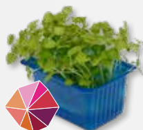
Atsina® Cress Zoete anijs, zoethout