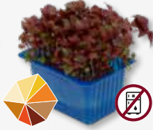
Shiso Purple Frisse komijn