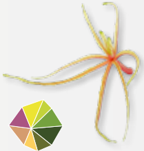
Aikiba® Leaves Gel-achtig, licht zoet-zuur