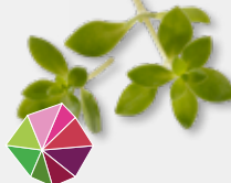
Gangnam Tops Fris, licht bitter