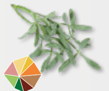
Sea Fennel Aromatisch, kruidig, asperge