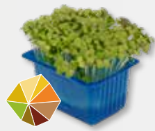
Mustard Cress Mierikswortel, wasabi 1)