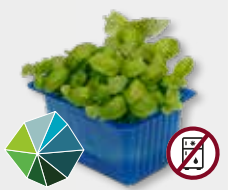
Basil Cress Basilicum