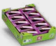
Purperkers (10x SinglePack) Kool