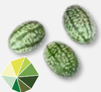
Pepquiño® Fris, licht zure komkommer 1)