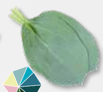
Oyster Leaves Ziltig, oester