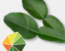
Kaffir Lime Leaves Zoete citrus, limoen