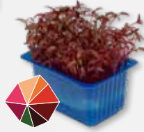
Scarlet Cress Milde rode biet