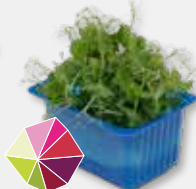
Affilla Cress® Verse doperwten