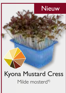
Kyona Mustard Cress Milde mosterd 1)