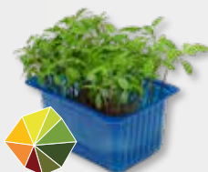
Aclla Cress® Fris, munt, citrus