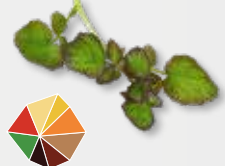
Hippo Tops Pittige waterkers