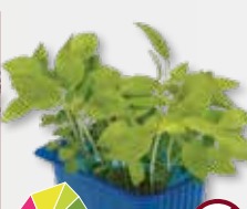
Limon Cress Limoen, anijs