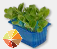
Borage Cress Zilt, oester, komkommer