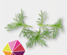
Paztizz Tops® Zoet, anijs