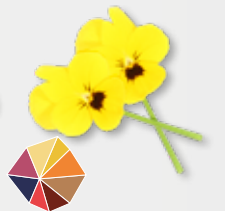
Cornabria Blossom® Frisse voorjaarsmaak