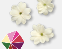
Jasmine Blossom Aromatisch, jasmijn