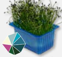
Rock Chives® Milde knoflook