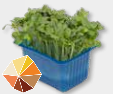
Daikon Cress® Rettich, rammenas