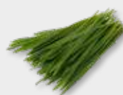
Wheat Grass 2) (Gesneden) Sterk zoet 3)