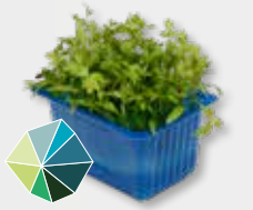
Motti Cress Aromatisch, selderij, maggplant (lavas)