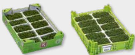
Tuinkers (10x) Mosterd, pittig, radijs