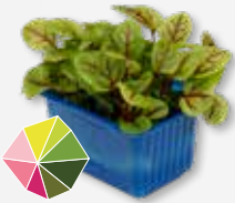
Vene Cress Licht zuur