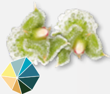
BlinQ Blossom® Fris, ziltig, zout