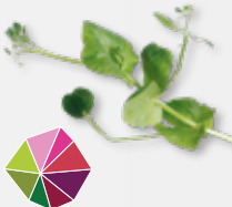
Salad Pea Subtiële erwtenmaak