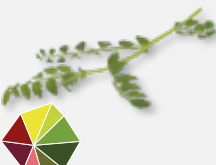
Hummus Leaves Kikkererwten