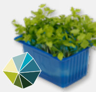
Persinette® Cress Peterselie