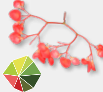
Apple Blossom Friszuur, groene appel