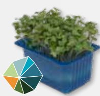
BroccoCress® Rauwe broccoli