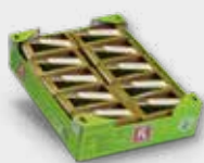
Tuinkers (10x SinglePack) Mosterd, pittig, radijs