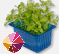
Honey® Cress Honingzoet