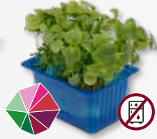
Shiso Green Munt, anijs